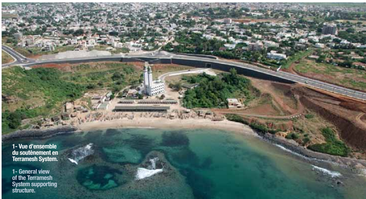
1- Vue d'ensemble du soutènement en Terramesh System.

LES OUVRAGES DE SOUTÈNEMENT DE GRANDE HAUTEUR ONT TOUJOURS ÉTÉ DIMENSIONNÉS POUR GARANTIR UN OUVRAGE FIABLE ET PERFORMANT. AUJOURD'HUI L'APPROCHE DE LA CONCEPTION A ÉVOLUÉ PUISQUE LA SENSIBILITÉ ENVIRONNEMENTALE EST DEVENUE PARTIE INTÉGRANTE DU PROCESSUS DÉCISIONNEL. LE CHALLENGE DU CHANTIER DE LA VOIE EXPRESS DE DAKAR A ÉTÉ DE TROUVER, POUR UN SOUTÈNEMENT DE 16 MÈTRES DE HAUT, LA SOLUTION PERFORMANTE, ADAPTÉE, QUI S'INTÈGRE DANS LE SITE ET À UN COÛT DE CONSTRUCTION AVANTAGEUX. DÈS LORS, LE CHOIX D'UNE SOLUTION TERRAMESH SYSTEM À PAREMENT MINÉRAL, ASSOCIÉ À DES GÉOGRILLES DE RENFORT À HAUTE RÉSISTANCE MÉCANIQUE, S'EST IMPOSÉ POUR LA CONSTRUCTION D'UN OUVRAGE DE GRANDE HAUTEUR EN FRONT DE MER ET SITE PROTÉGÉ.